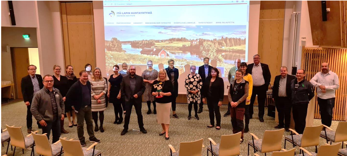
Kuva laajennetun elinkeinotiimin kokouksesta Naavassa 15.9.2020.

Kuntayhtymän kautta toimivat seuraavat toimialatiimit: 1) Elinkeinotiimi, 2) Sivistystiimi, 3) Tekninen tiimi ja 4) Sotetiimi sekä Itä-Lapin hyvinvointityöryhmä.