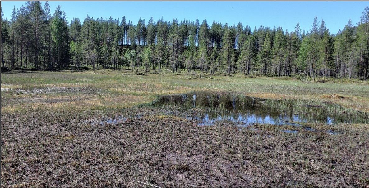
Kuva 2. Alueen keskellä sijaitsee oligotrofinen rimpineva. Taustalla näkyvä harju kuuluu suunnittelualueen eteläosaan.

kaivettu oja. Ojan vaikutus heijastunee alueen eteläosaan. Suoalue on oligotrofista lyhytkorsirimpinevaa sekä oligotrofista lyhytkorsirämettä (Kuva 2). Lajistossa vallitsevat rämeosissa rämevarvut ja nevaosissa tupasluikka, tupasvilla, suokukka ja pyöreälehtikihokki. Rahkasammaleet ovat runsaina pohjakerroksessa. Molemmat näistä luontotyypeistä on luokiteltu elinvoimaisiksi (LC) luontotyypeiksi viimeisimmässä uhanalaisuusarvioinnissa. Alueella ei havaittu lainkaan lähteisyyttä tai lähdelajeja. Erityisesti huomioitiin suon ja kivennäismaan reunaosat, joista pohjavesi yleensä purkaantuu. Ravinteisempaa lajistoa ei löytynyt lainkaan. Eteläisemmän korttelammen länsiosassa kivennäismaan reunalla on havaittu aiemmin tihkupintaisuutta, mutta se on tämän kaavoitusalueen ulkopuolella. Kaava-alueen koillisnurkassa olevassa pohjoisemmassa Korttelammessa vesi on hyvin kirkasta, vaikka se on soiden ympäröimä. On todennäköistä, että veden kirkkaus johtuu pohjaveden vaikutuksesta. Lähteisyyden takia lampi voi olla lähdelampi, joka kuuluu puutteellisesti tunnettuihin luontotyyppeihin (DD). Lammessa oli runsaasti tytönkorentoja sekä mahdollisesti vaskikorentoja.