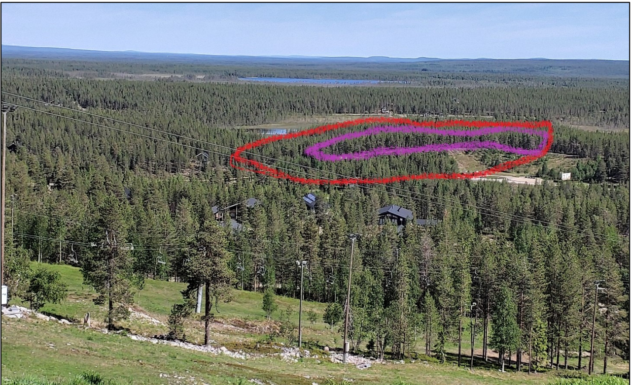
Kuva 4. Punaisella viivalla on rajattu suurin piirtein kaava-alueen sijoittuminen maisemaan, joka avautuu Pyhätunturin hotellitasanteelta. Violetilla on piirretty korkein harjumuodostuma, josta on suora näkyväisyys hotelille ja tunturille päin.

Nykyisen kaava-alueen vapaa-ajanasunnot sijoittuvat muutamalle kadun varrelle. Kumpuilevan maaston ja puuston peitteisyyden takia nykyiset loma-asunnot eivät näy esimerkiksi Pyhätunturin hotellitasanteelta (Kuva 4). Rakentamisessa kannattaa hyödyntää maaston peitteisyyttä ja harjujen peittoa. Kaikkein herkin alue maisemallisesti on vanhan soranottoalueen takainen maasto. Nykyisin soranottoalue on käytössä liukumäkialueena talvisin ja kesäisin skeittialueena. Harjun päälle sijoittuvaa rakentamista tulee välttää, sillä näistä kohteista voi muodostua helposti tahaton maamerkki, joka hallitsee maisemaa. Harjun pohjoispuolelle rinteeseen voinee sijoittaa rakennuksia, jotka eivät maisemassa erotu. Samoin valokuvan 4 violetin alueen oikealle puolelle voi kaavoittumista tehdä, kuitenkin niin, että reunalle jätetään puustoinen reunavyöhyke. Rakentaminen tulisi olla mökkimäistä, välttäen laajoja ja kookkaita rakennuskokonaisuuksia.