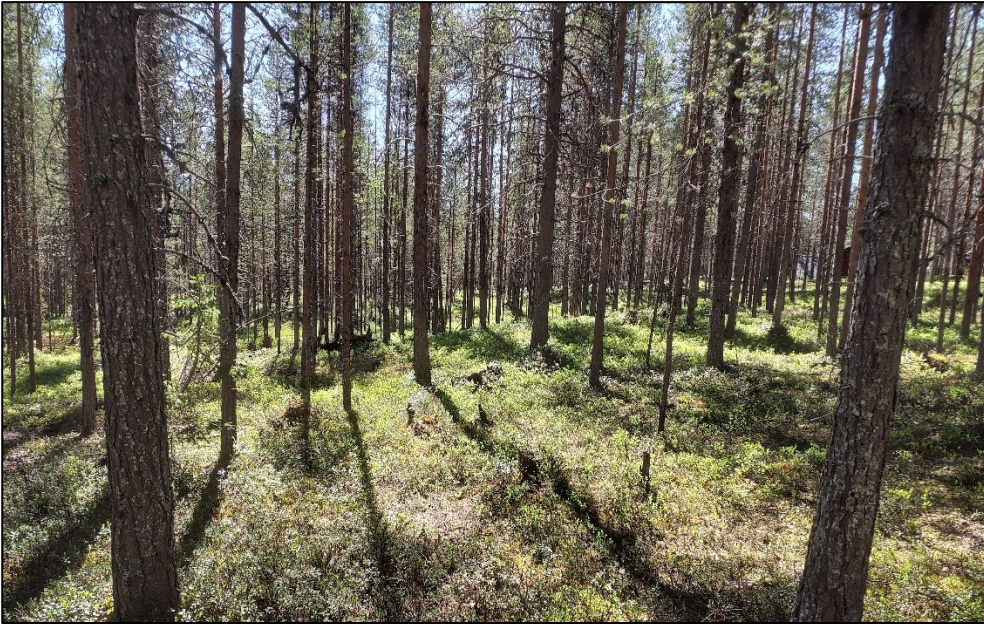
Kuva 3. Kaavoitusalueen pohjoisosassa olevaa kuivahkon kankaan metsää. Valokuvassa näkyy oikealla metsän peiton takaa Näätäharjunkadulla sijaitseva loma-asunto.