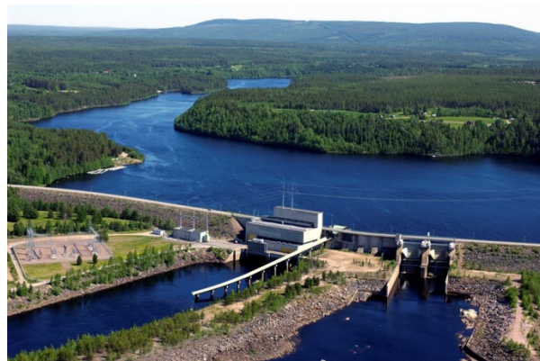
Kuva 3. Vanttauskosken voimalaitos Rovaniemellä.

myös Posion biovoimalaitos sekä suunnitteilla oleva Mustikkamaan biovoimalaitos.