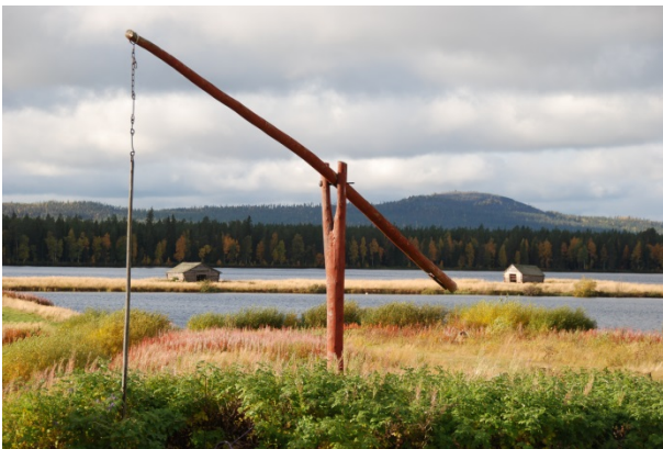
Kuva 4. Maisemaa Suvannon kylästä Pelkosniemeltä.

Osa-aluemerkinnällä maV pääasiallisen maankäyttöluokan päälle osoitetaan valtioneuvoston päätöksen (VNp 5.1.1995) mukaiset valtakunnallisesti arvokkaat maisema-alueet. Valtakunnallisesti merkittävät kulttuuriympäristöt (RKY 2009) osoitetaan maV-merkinnällä silloin, kun niitä ei ole osoitettu SR-/SR-1-kohteina.