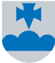
Kuva 3 Vaakuna muistuttaa ajasta, jolloin Kemijärven kirkkoherra vuoden 1648 tienoilla kastoi Pyhätunturin Pyhän kasteen lähteellä tunturialueella asuvia lappalaisia kristinuskoon.

Pelkosenniemen kunnan vaakunassa on kuvattu sinisellä Pyhäristi (naularisti) ja sinihopeakatkoinen kolmoisvuori, joka kuvaa Pyhätunturia. Pohjana on hopeakenttä. Heraldikko Ahti Hammar on vuonna 1960 suunnitellut kunnanvaltuuston 16.1.1960 vahvistaman vaakunan.