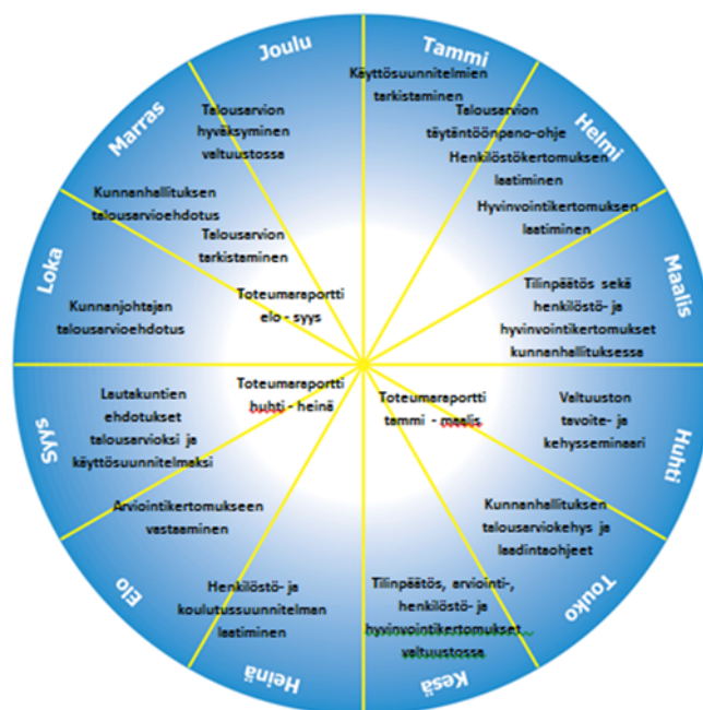
Kuva 5 Kunnassa hyödynnetään talousviestinnässä visualisointia siten, että se tukee määrärahojen riittävyyden ennustamista ja tehostaa talouden seuranta.

Kunnan on kuntalain mukaan laadittava talousarvio edellisen vuoden loppuun mennessä. Tilinpäätös on laadittava maaliskuun loppuun mennessä. Vuoden aikana laaditaan myös useita toteumaraportteja, joista yksi merkittävimmistä on puolivuotiskatsaus, jossa raportoidaan myös toiminnallisten tavoitteiden toteutumisesta. Kalenterivuoden aikana talousasioiden viestintään kytkeytyy myös mm. hyvinvointikertomus sekä henkilöstö- ja koulutussuunnitelma vuosikellossa esitetyllä tavalla.